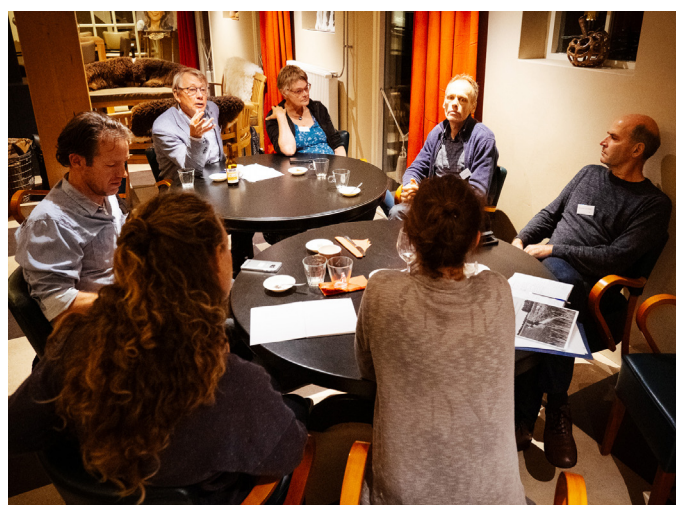
Workshopdeelnemers in een geanimeerde discussie

De omgevingsvisie landelijk gebied, die Ede aan het opstellen is, bekijkt al deze onderwerpen in hun onderlinge samenhang. We merken dat onze Europese partners met veel interesse kijken hoe wij dit soort zaken in Ede aanpakken.