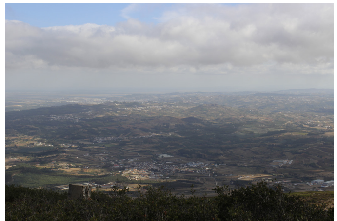
Área Metropolitana de Lisboa, onde o urbano e o rural apresentam-se mais como um mosaico do que como duas realidades distintas

O Living Lab de Lisboa corresponde à NUTSIII da Área Metropolitana de Lisboa. O território encontra-se marcadamente ocupado por áreas edificadas (cerca de 1/3 em 2010), particularmente no núcleo e na envolvente próxima. Todavia, perto de 50% do solo da região tem como usos principais a agricultura e a floresta.