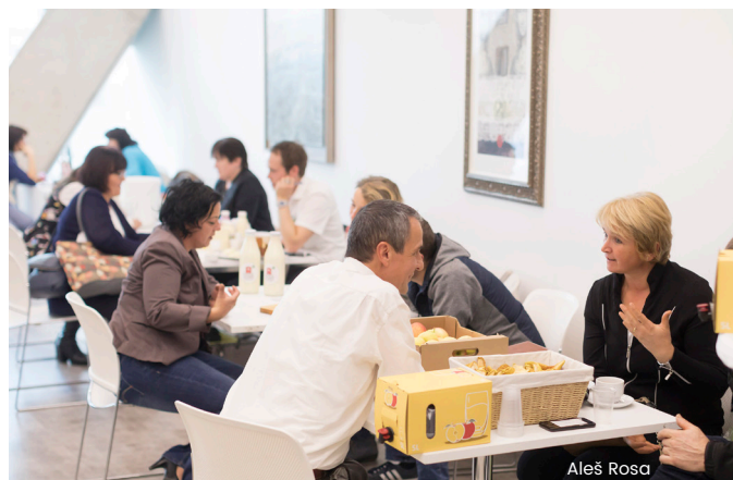
Jesenska borza lokalnih živil Osrednjeslovenske regije, Ljubljana 14.11.2018

Nekateri deležniki, ki sodelujejo v živem laboratoriju Ljubljanske urbane regije, med seboj sodelujejo že nekaj časa. Javne inštitucije, restavracije in manjši proizvajalci hrane zadnji dve leti poskušajo uskladiti svoje interese ter zbrati informacije o povpraševanju in ponudbi hrane v regiji. Sodelovanje se je pričelo v Ljubljani, cilj živega laboratorija, ki ga vodita raziskovalni partner Oikos ter izvajalec vsebin Regionalna razvojna agencija Ljubljanske urbane regije, pa je razširiti sodelovanje v celotni regiji z okoli pol milijona prebivalci.