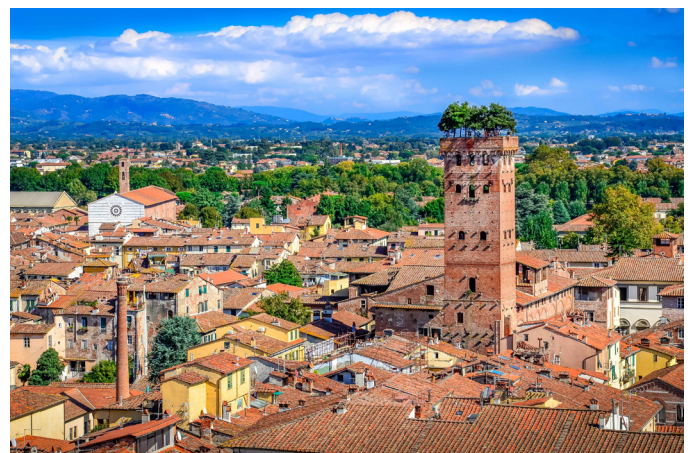
Torre Guinigi, Lucca.

La Provincia di Lucca – con i Comuni di Lucca e Capannori – ha aderito nel Maggio 2018 al Patto di Milano per le Politiche Alimentari Urbane . Contestualmente, i Comuni di Lucca, Capannori, Altopascio, Porcari e Villa Basilica hanno avviato il percorso partecipativo CIRCULARIFOOD allo scopo di definire il Piano Intercomunale del Cibo per la Piana di Lucca, ossia un piano di azioni per sviluppare una local food policy , con un organismo di coordinamento: il Consiglio del Cibo. Decine di attori del territorio hanno preso parte a CIRCULARIFOOD e alla definizione di cinque linee d'azione. Da qui parte il LL di ROBUST, al fine di identificare modelli di governance utili a favorire la riconnessione tra rurale e urbano, attraverso il tema del cibo, sia dal punto di vista della tutela e fruibilità del territorio rurale, che per intervenire sugli strumenti di pianificazione territoriale e frenare i fenomeni di dispersione insediativa e consumo di suolo.